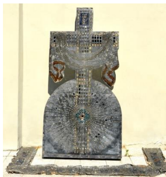
kříž k Božímu hrobu s ozdobným rámem

Při pořizování fotografií k článkům připravovaným k letošním významným výročí kostela jsem byl upozorněn na zvláštní kříž nalezený před léty při opravě střechy kostela. Tehdy mu nebyla věnována pozornost, poněvadž nikdo z pamětníků si nevzpomínal na jeho používání. Kříž jsem viděl sice poprvé, ale velice mne zaujal svým neobvyklým tvarem i řemeslným zpracováním. Odušil jsem, že se možná jedná o neobvyklé umělecko-řemeslné dílo, které si zaslouží záchranu, pořídil jsem fotodokumentaci a začal jsem pátrat. Kříž působí mohutně, je vysoký 190 cm, v základně měří 97 cm a délka vodorovného ramene je 90 cm. Je vytvořen dřevěnou konstrukcí v tloušťce 15 cm, která podtrhuje jeho masivnost. Konstrukce je polepena kartonem, který je již značně poškozen plísní. Jedinečný dojem vytváří dekorace čelní stěny, která je pokryta barevnými skleněnými slzičkami a válečky připevněnými do kartonu drátky. Vedle kříže byly nalezeny doplňující dekorace ve stejném provedení jako kříž a velmi poškozený zbytek textilie s vyšíváním geometrickými vzory.