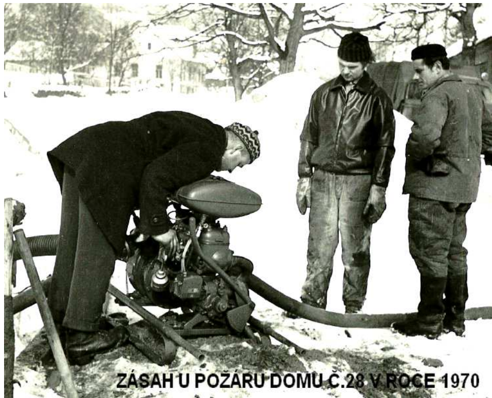
ZÁSAH U POŽARU DOMU Č.28 V ROCE 1970

od roku 1923 knihovnu. Tato byla zrušena až po únoru 1948. Další velkou ránou rozvoje společenského života v obci byla druhá světová válka a okolnosti jí předcházející. 10. října 1938 zabrala německá armáda Sudety a také Střítež nad Ludinou. 24. listopadu 1938 sice obec Střítež ze záboru vyvázla, ale netrvalo dlouho a německá nadvláda se znovu projevila. Členové hasičského sboru byli povoláni na nucené práce do Německa, všechny nápisy musely být vedeny dvojjazyčně, činnosti spolku byly různými příkazy omezeny. I v této těžké době si sbor v roce 1943 připomněl padesáté výročí trvání. Podle zápisu z valné hromady bylo 176 činnými členy sboru, 15 čestných členů sboru a 82 občané byli přispívajícími členy. Na konci války dolehla německá okupace naplno i na hasičský sbor.