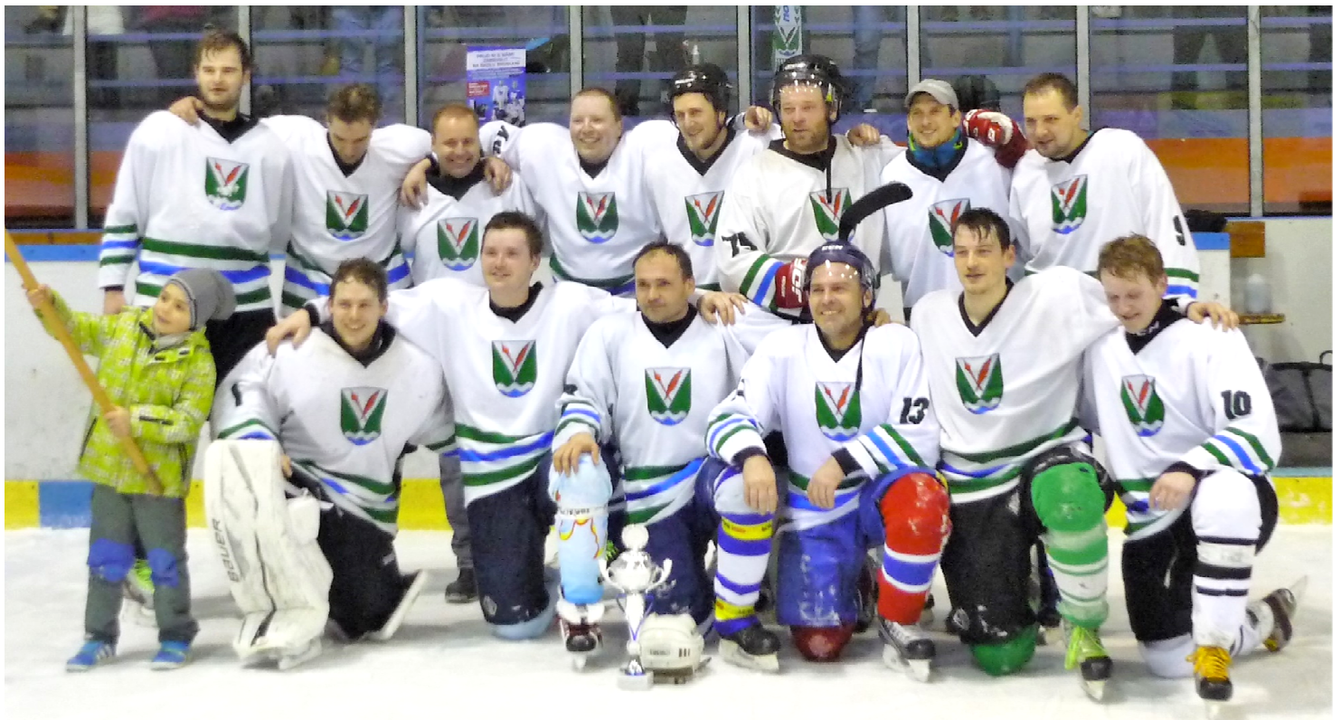
Horní řada : Mozi, Kobra, Lad'a, Plech, Jerry, Bizon, Motýl, Šváb

Teď už jsme zhruba v jedné třetině sezóny 17/18 a stále se nám daří docela dobře. Držíme se na čtvrtém místě tabulky a z deseti zápasů jsme pohráli jen dva, takže našlápnuto do play off rozhodně máme. Navíc jsme tým,